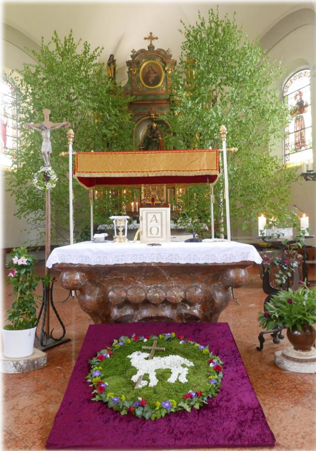
Fronleichnam in der Pfarrkirche St. Oswald

O heilige Seelenspeise auf dieser Pilgerreise, O Manna Himmelsbrot! Wollst unsern Hunger stillen, mit Gnaden uns erfüllen, uns retten vor dem ewgen Tod.